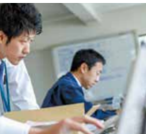
販売部門の社員。「一人一人が経営意識を持って仕事に取り組んでいる」と鳥井社長は評価する。