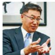
社長職に就いたのは平成21年。長年営業マンとして数々の企業に足を運んできたからこそ、「ものづくり」の業界に熱い思いがある。