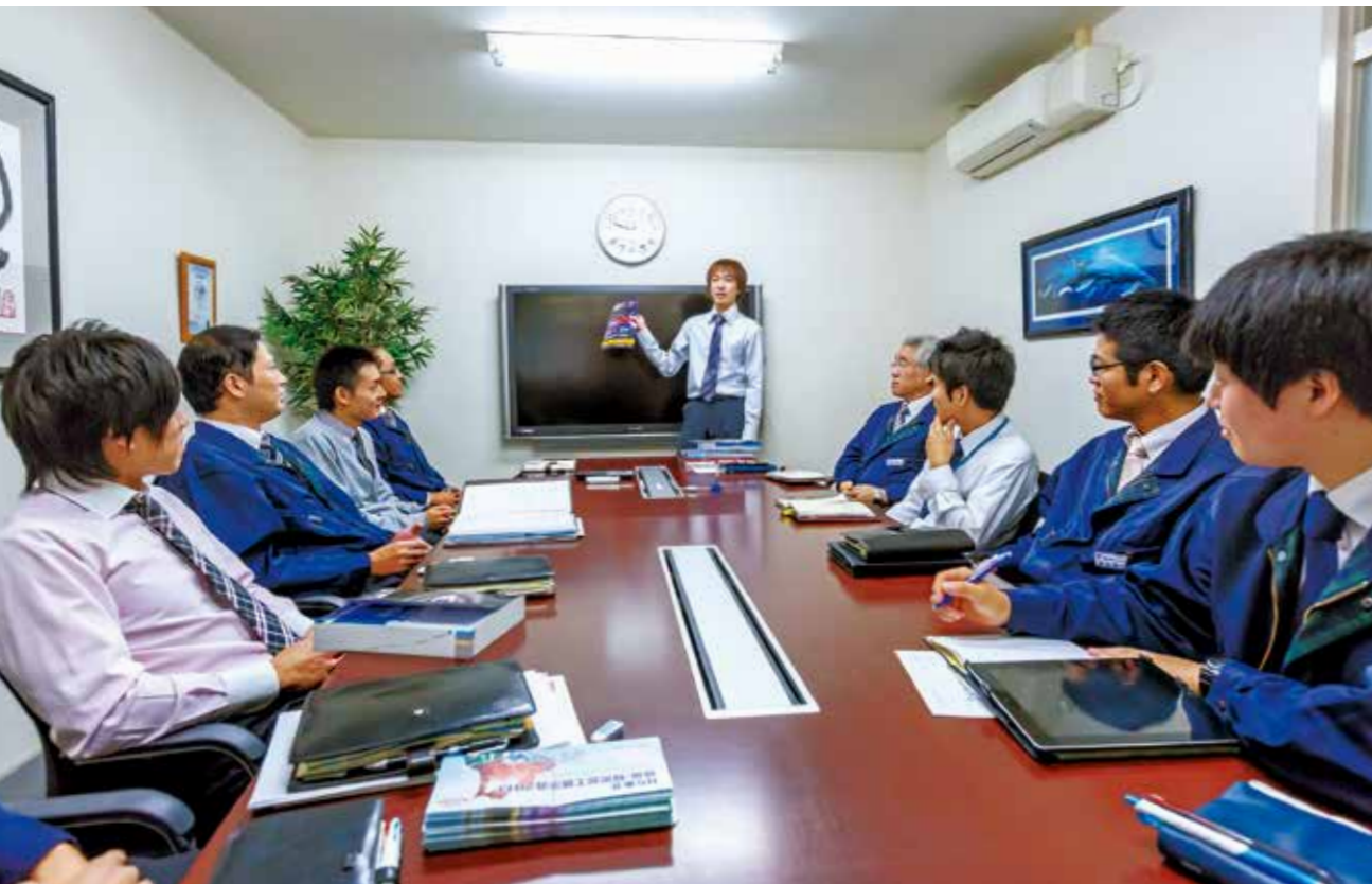
営業を担う販売部門のミーティング風景。営業の結果報告、情報交換を積極的に行っている。販売部門の社員は30歳前後が最も多い。