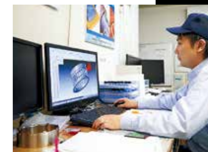
製造部設計部門・入社7年目の社員。販売部同様、製造部でも若い社員が第一線で活躍している。鳥井社長は、若い技術者を積極的に採用し、事業拡大を目指す方針である。