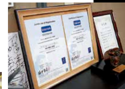
同社では平成20年10月に、環境マネジメント国際規格「ISO14001:2004」の認証を取得。省エネ、省資源化を進め、コスト削減を実行している。