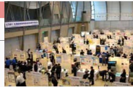
とうほく・北海道 展示商談会 会場風景 (平成26年度)