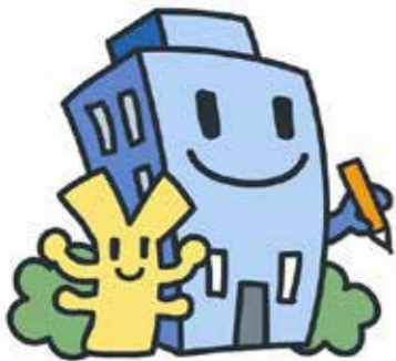
経済センサスキャラクター