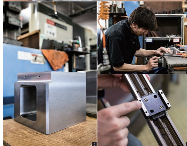
1~4 大小さまざまな機械部品を製造。自身の言葉を尊び、やると言ったら必ずやる有言実行の職人たちへの信頼は厚い。