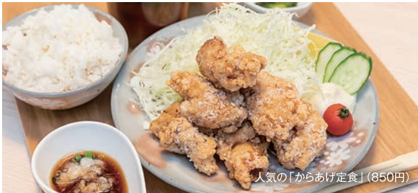
人気の「からあげ定食」(850円)