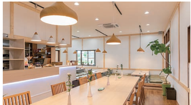
ランチは定食やラーメン、夜は鳥もつや水炊き等、家族連れをはじめ幅広い世代の客層で連日賑わいを見せる。