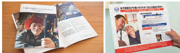
クラウド上で綴られた物語は最後に一冊の本にすることもできる。