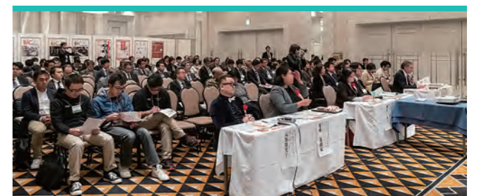
生活者視点からビジネス視点まで、審査員の質疑にも熱がこもる