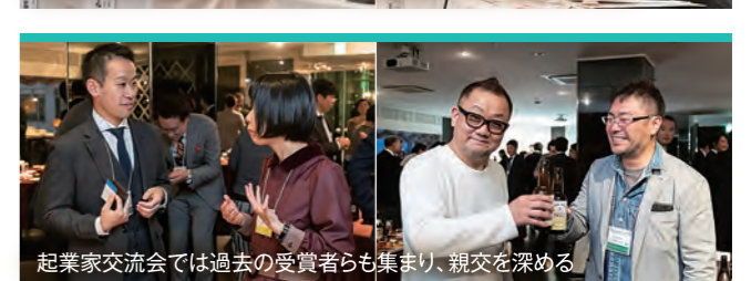
起業家交流会では過去の受賞者らも集まり、親交を深める