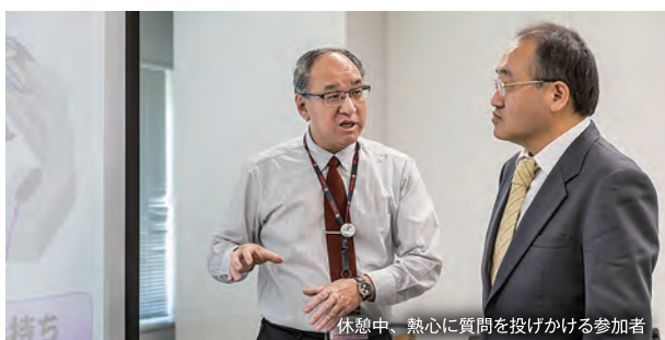
休憩中、熱心に質問を投げかける参加者

同セミナーは県およびあきた自動車産業振興協議会が主催するもので、製造工程の品質管理、品質と安全の関わりについて理解を広めることを目的に、上林PMが就任以降、毎年継続してきたもの。当初は秋田市のみで開催していたが、参加企業や製造に携わる企業から要望があり、県北・県南地区も会場に加わった。会場が増えたことで、現場に関わる若手や中堅が気軽に参加できるようになり、現在までの受講者は延べ110社250名を数える。