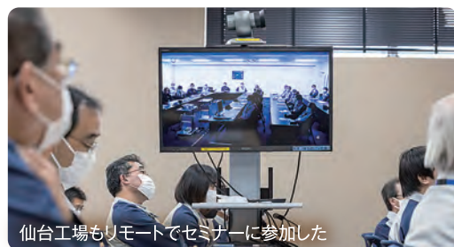
仙台工場もリモートでセミナーに参加した