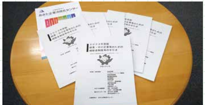
2023年度版「創業・中小企業等のための補助金制度の手引き」あきた企業活性化センターで相談者へお渡ししています。