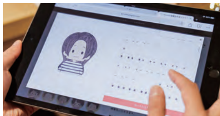
アバター要素を入れ込むため、イラストレーターに提供してもらったパーツは1,000を超える。