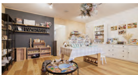
3月にオープンしたばかりの能代駅前の実店舗。