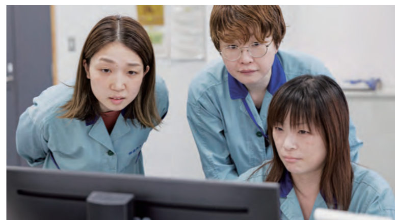
生産管理係では指示書を作成し、製造工程に指示を行う。