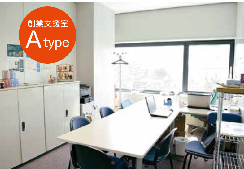
創業支援室 A type