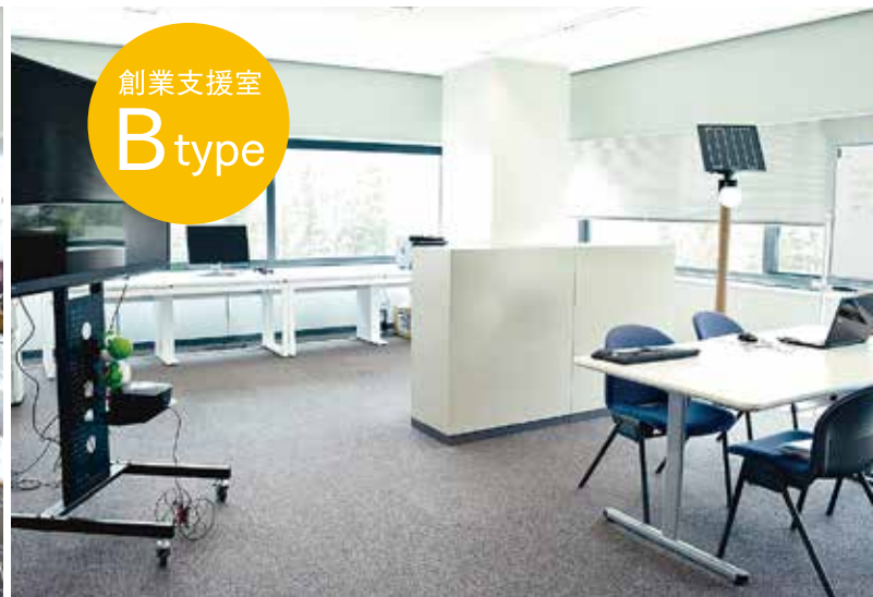
創業支援室 B type