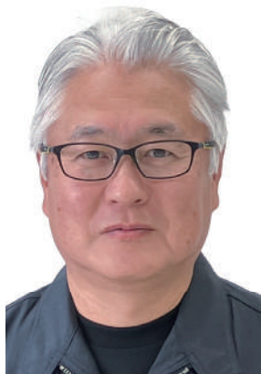
パネルディスカッション 登壇者