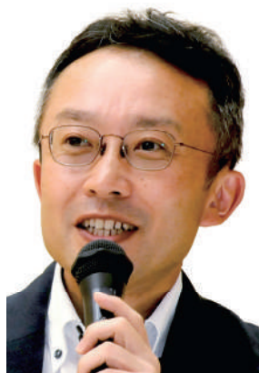
パネルディスカッション ファシリテーター