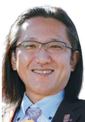
パネルディスカッション 登壇者