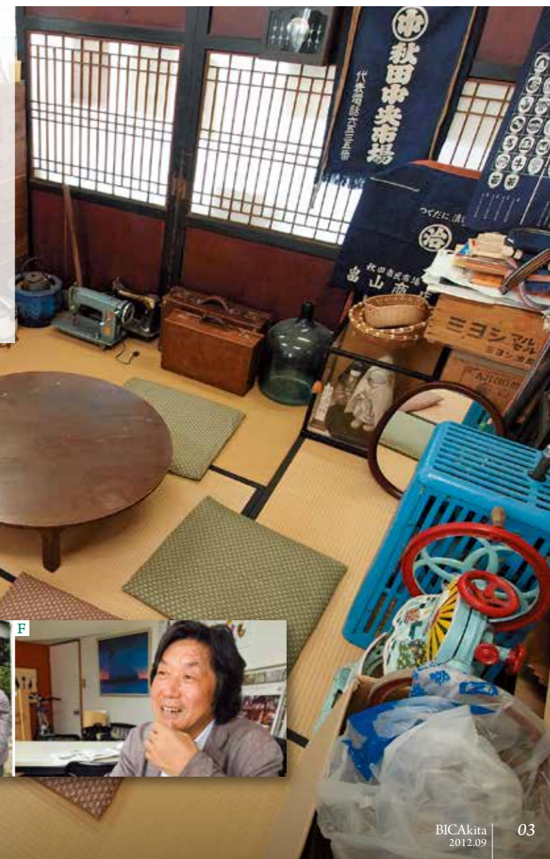
スタッフの休憩スペースは遊び心満載だ。