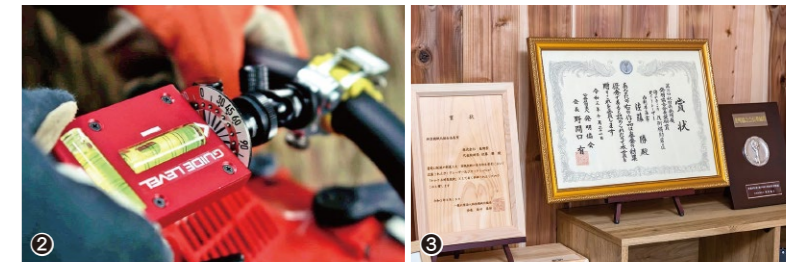
①コンパクトで持ち運びがしやすく、新人からベテランまで簡単に使用できる。 ②角度板で15度ピッチ毎に設定が可能。 ③社長室には、賞状や特許証が並ぶ。