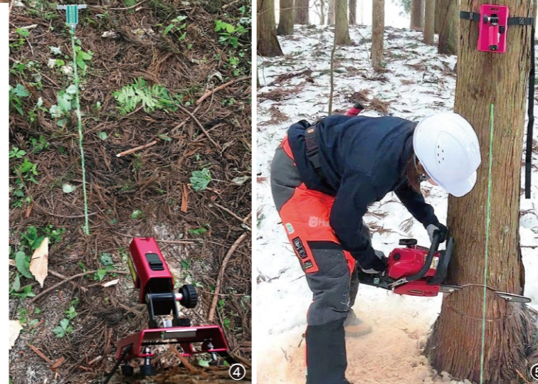
④レーザーを反射板に照射し、伐倒目標位置を定める。 ⑤レーザーをガイドに正確な伐倒方向を確認しながら「受け口」を作ることが可能に。 ※レーザーを見やすくするため、写真を一部加工しています。