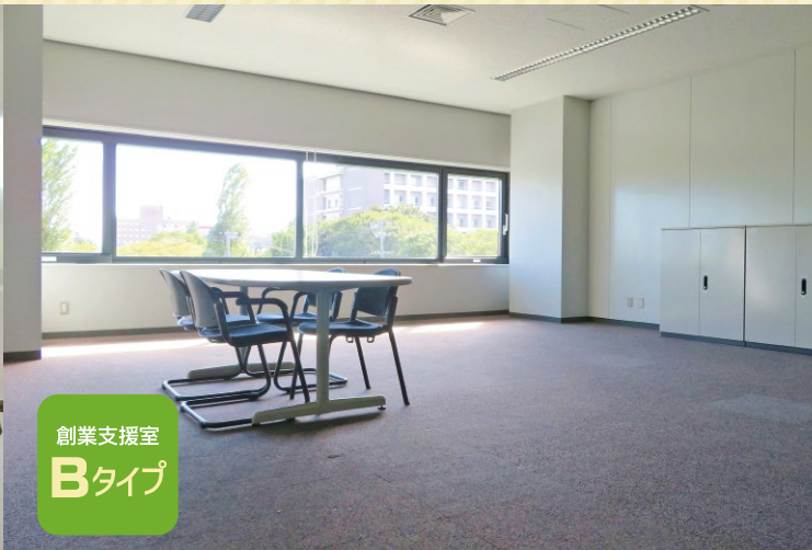
創業支援室 Bタイプ