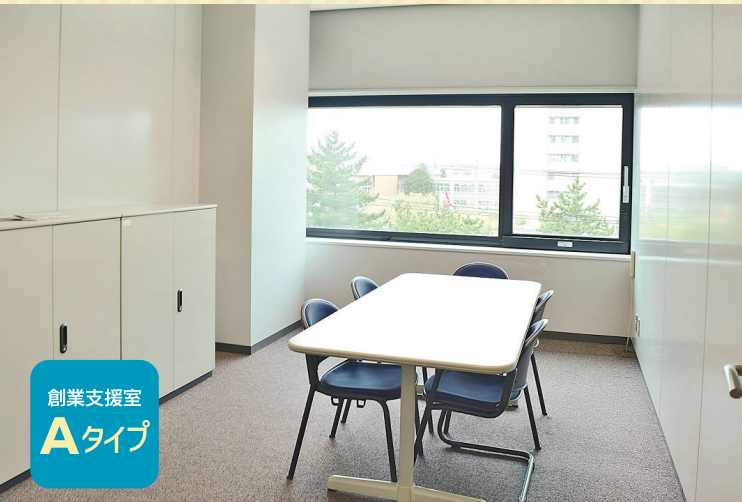
創業支援室 Aタイプ

ビッグあきた vol.485 2021年11月30日発行 編集・発行/公益財団法人あきた企業活性化センター 〒010-8572 秋田山王三丁目1番1号 TEL.018-860-5610 FAX.018-863-2390 本誌は、賛助会員への配布となっております。購読を希望される場合は、上記までお申し込みください。