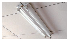
業務用・施設用蛍光灯の安定器