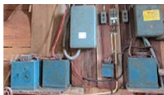
低圧進相コンデンサー